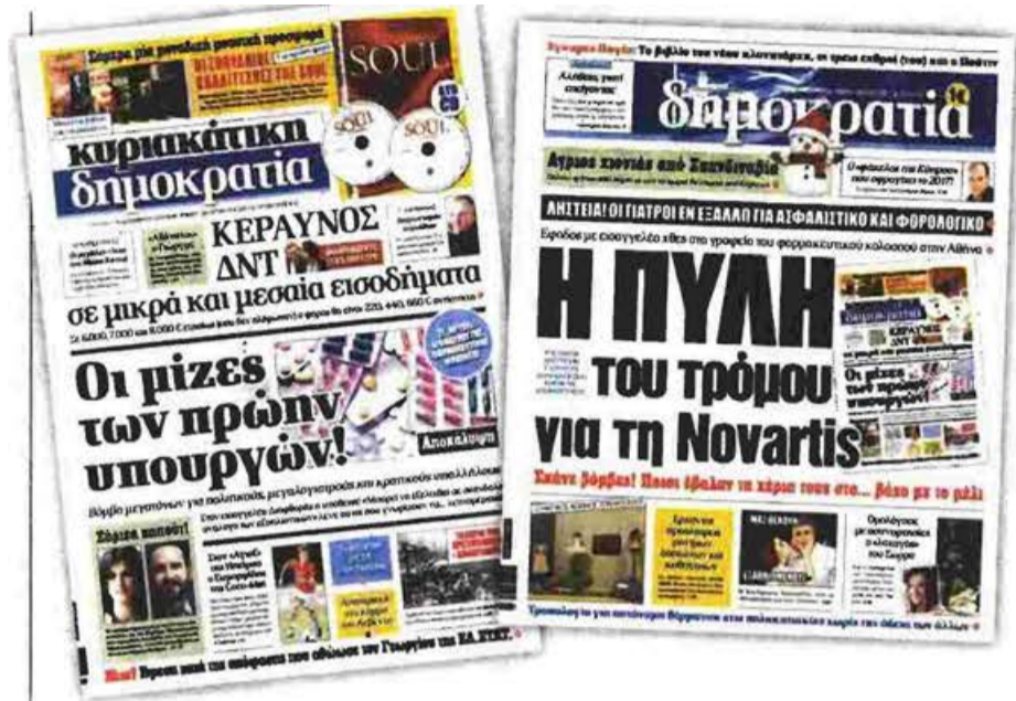
Το πρωτοσέλιδο της «κυριακάτικης δημοκρατίας» στις 18 Δεκεμβρίου 2016 (αριστερά) Το πρωτοσέλιδο της «δημοκρατίας» στις 4 Ιανουαρίου 2017 (δεξιά)