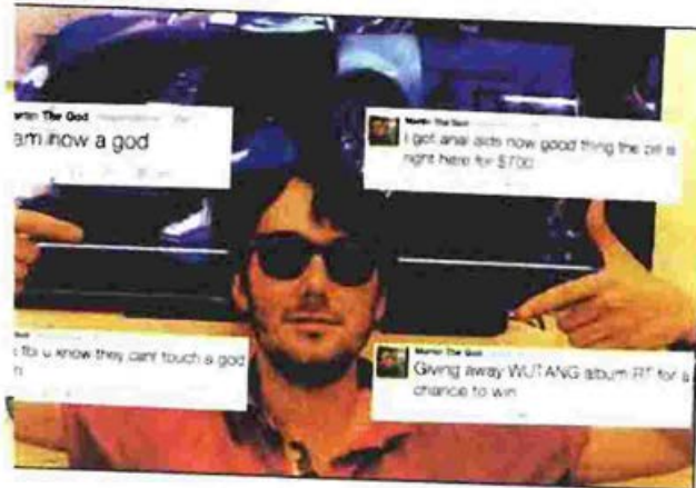
Θρασύς ο Shkreli, προκαλούσε με τα tweets του, στα οποία έλεγε ότι είναι «θεός», ότι δεν τον αγγίζει το FBI και ειρωνευόταν τους ασθενείς του AIDS

πραγματικότητα, αντίθετα αρκετοί από τους επενδυτές, αλλά και οι εταιρίες, κέρδισαν χρήματα, η απάτη δεν παύει να είναι απάτη και γι' αυτή καταδικάστηκε. «Είναι σαν να κλέβεις μια τράπεζα για να αποπληρώσεις τις οφειλές σου σε μια άλλη τράπεζα», εξήγησε ένας αναλυτής στη δίκη.