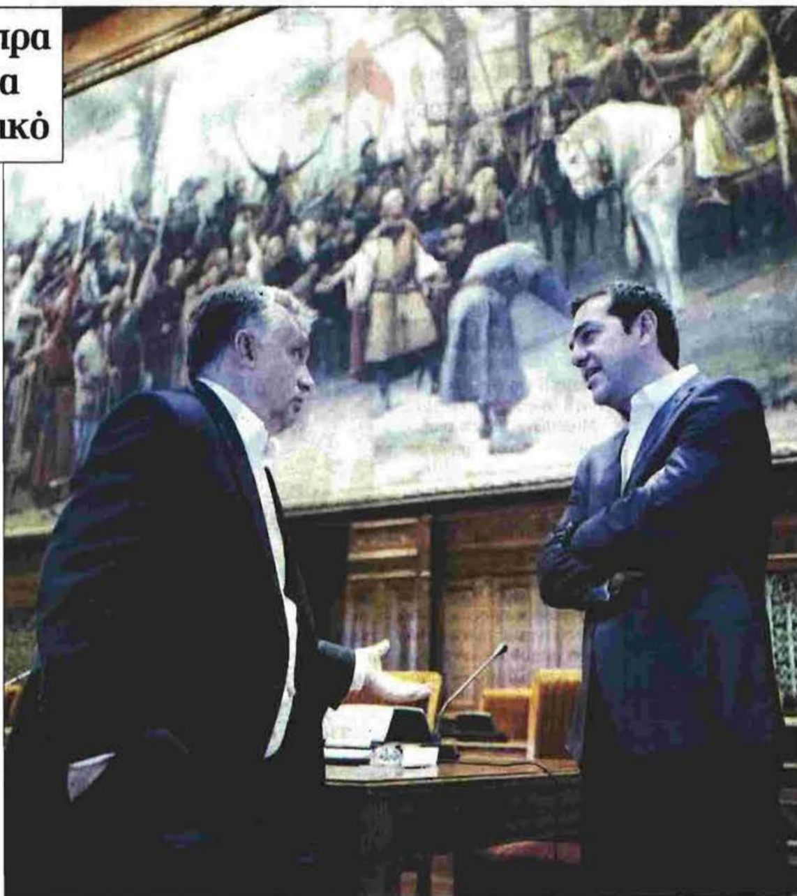
Από τη χθεσινή συνάντηση Αλέξη Τσίπρα - Βίκτορ Ορμπαν στο ουγγρικό Κοινοβούλιο

Ο πρωθυπουργός δέχτηκε τα εύσημα του γενικού διευθυντή του ΠΟΥ Τέντρος Αντσανόν Γκεμπρεγέσους για τις προσπάθειες που γίνονται στον τομέα της Υγείας και κυρίως σε ό,τι αφορά τη φροντίδα των προσφύγων και των μεταναστών. Ο κ. Τσίπρας,