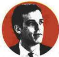
ΠΑΝΑΓΙΩΤΗΣ ΑΡΚΟΥΜΑΝΕΑΣ ΠΡΟΕΔΡΟΣ ΤΟΥ ΕΘΝΙΚΟΥ ΟΡΓΑΝΙΣΜΟΥ ΔΗΜΟΣΙΑΣ ΥΓΕΙΑΣ

Σύμφωνα με όσα εξήγησε στα «Π» ο πρόεδρος του Εθνικού Οργανισμού Δημόσιας Υγείας (ΕΟΔΥ), Παναγιώτης Αρκουμανέας, «πρόκειται για μια στρατηγική η οποία στοχεύει κυριαρχικά στην προστασία των ευπαθών και των ευάλωτων κοινωνικών ομάδων, καθώς και των ομάδων εκείνων οι οποίες διαβιούν σε κλειστές δομές». «Μην ξεχνάτε ότι, κατά τη διάρκεια του πρώτου κύματος της εξάπλωσης της επιδημίας του νέου κορονοϊού στη χώρα μας, δεν είχαμε κανέναν θάνατο σε μονάδες φροντίδας ηλικιωμένων, γηροκομεία και άλλες κλειστές δομές, τη στιγμή κατά την οποία σε άλλες ευρωπαϊκές