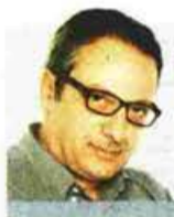
ΤΟΥ ΠΕΡΙΚΛΗ ΔΗΜΗΤΡΟΠΟΥΛΟΥ

Από τα στοιχεία γίνεται σαφές πως η πλούσια Δύση έχει πάρει τη μερίδα του λέοντος στις δόσεις που θα διατεθούν