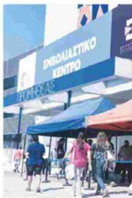
Από τις 28/6 , που ανακοινώθηκαν τα κίνητρα εμβολιασμού για τους νέους, δλώθηκαν περίπου 270.000 νέα ραντεβού στις ηλικίες 18-25 ετών.

Υπενθυμίζεται πως με την ψηφιακή κάρτα όλοι οι δικαιούχοι μπορούν να αγοράσουν υπηρεσίες πολιτισμού και τουρισμού αξίας 150 ευρώ, ενώ ήδη μεγάλες ιδιωτικές εταιρείες, όπως η Aegean Air και η Blue Star Ferries, έχουν διπλασιάσει το παρεχόμενο ποσό, προσφέροντας ειδική έκπτωση σε κάθε νέο και νέα που θα τις επιλέξει για να ταξιδέψει αυτό το καλοκαίρι. Δικαιούχοι του Freedom Pass είναι όλοι οι νέοι 18-25 ετών που έχουν πραγματοποιήσει την πρώτη δόση ή έχουν ολοκληρώσει τον εμβολιασμό τους από 1.1.2021 έως 31.12.2021.